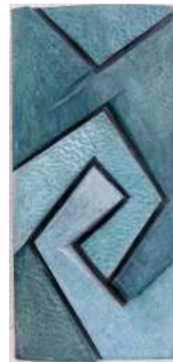
"Ringen um die Mitte" Esche / Eitempera

Der Mensch ist Mittelpunkt seiner Arbeiten. Seiner Meinung nach vermitteln seine Skulpturen, Reliefs und Bilder Botschaften. Mittelpunkt, Zentrum, Bausteine, Maß und Mitte sind Begrifflichkeiten, die häufig in den Arbeiten von E.K. benannt werden. Diese Angebote werden von vielen Menschen als "Hilfestellung" für den eigenen Weg erkannt.